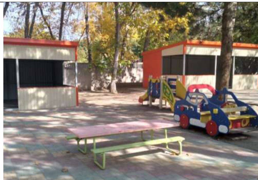
Прогулочная площадка группы «Колосок»

Теневой навес - 1, песочница распашная -1, детский домик «Елочка» -1, машина «Полиция» -1, скамья– 1, стол со скамейками – 1.