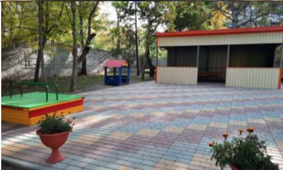
Прогулочная площадка группы «Вишенка»

Теневой навес -1, игровой детский домик «Елочка»-1, песочница-1, скамья – 1.