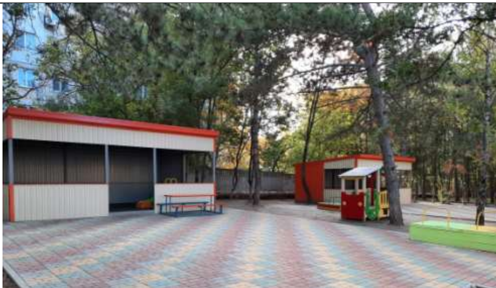
Прогулочная площадка группы «Цветик-семицветик»

Теневой навес - 1, песочница -1, стол со скамейками –1