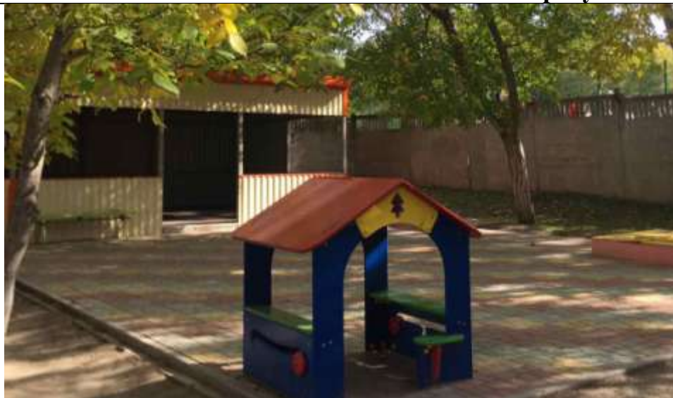
Прогулочная площадка группы «Пчелка»

Теневой навес -1, игровой детский домик «Елочка»-1, песочница-1, скамья – 1.