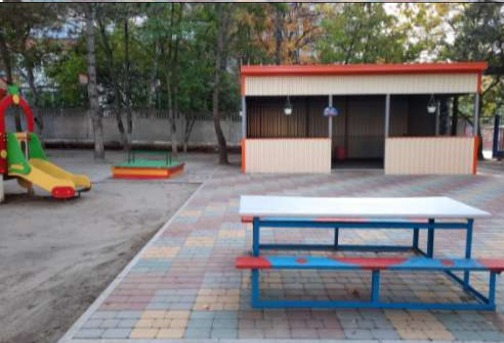
Прогулочная площадка группы «Капитошка»

Теневой навес - 1, песочница -1, стол со скамейками –1