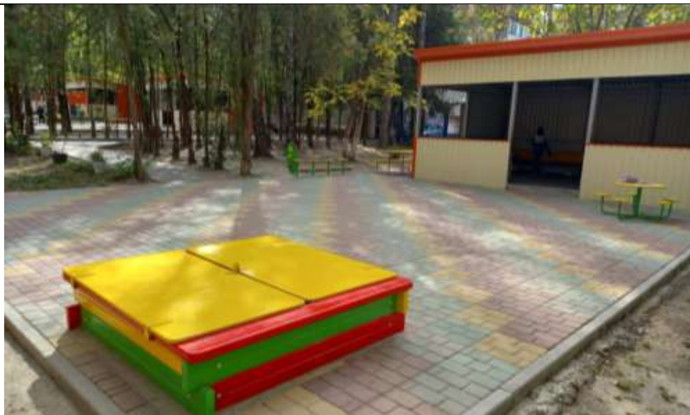
Прогулочная площадка группы «Ромашка»

Теневой навес - 1, песочница распашная -1, стол детский «Семицветик» -1, скамейка «Гусеница» - 1, стол со скамейками –1.