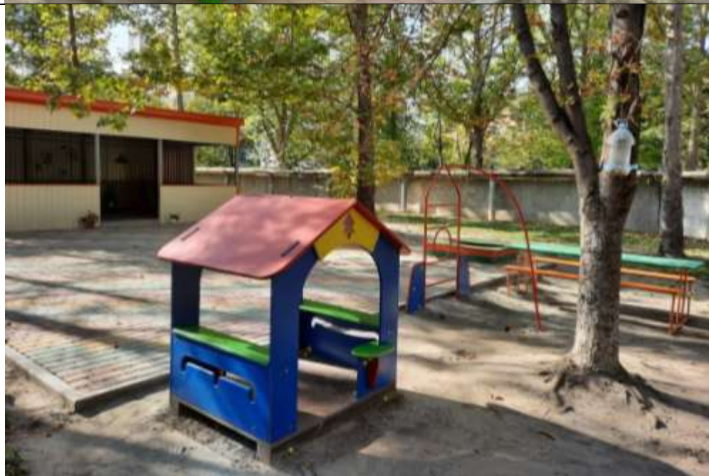
Прогулочная площадка группы «Слоненок»

Теневой навес - 1, песочница распашная -1, стол детский «Семицветик» -1, скамейка «Гусеница» - 1, стол со скамейками –1.