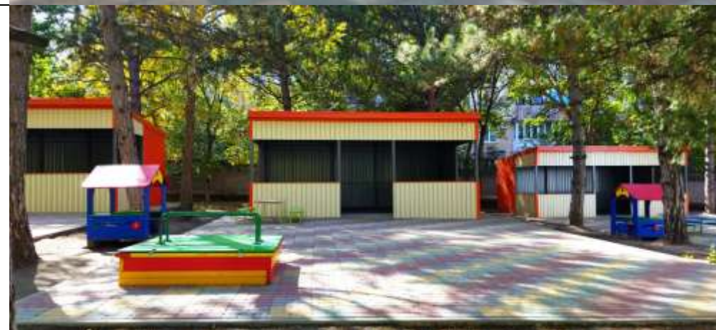
Прогулочная площадка группы «Подсолнушек»

Теневой навес - 1, песочница распашная -1, детский домик «Елочка» -1, машина «Полиция» -1, скамья– 1, стол со скамейками – 1.