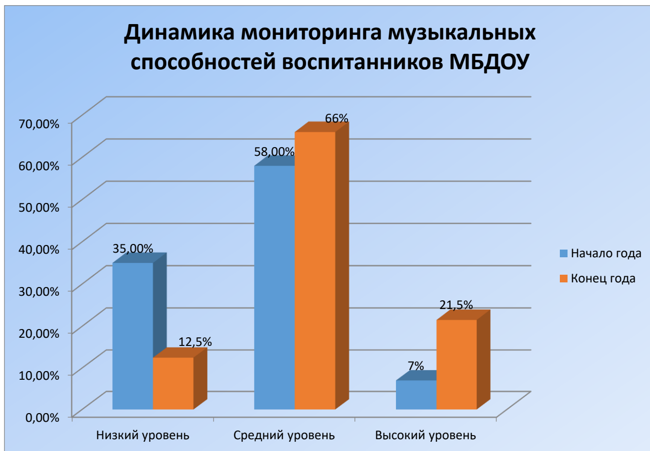
Рис. №2 Динамика мониторинга музыкальных способностей воспитанников МБДОУ

В течение года наблюдается положительная динамика в развитии музыкальных способностей детей. Воспитанники младших, средних, старших групп овладели необходимыми умениями и навыками в соответствии с возрастными особенностями, успешно освоили программу музыкального воспитания, сократилось количество детей с низким уровнем. Положительная динамика достигнута за счет правильно построенной, индивидуальной систематической работы с детьми по всем направлениям, создания условий для проявления музыкальных и творческих способностей во всех видах музыкальной деятельности. А также тесного взаимодействия с воспитателями групп и родителями.