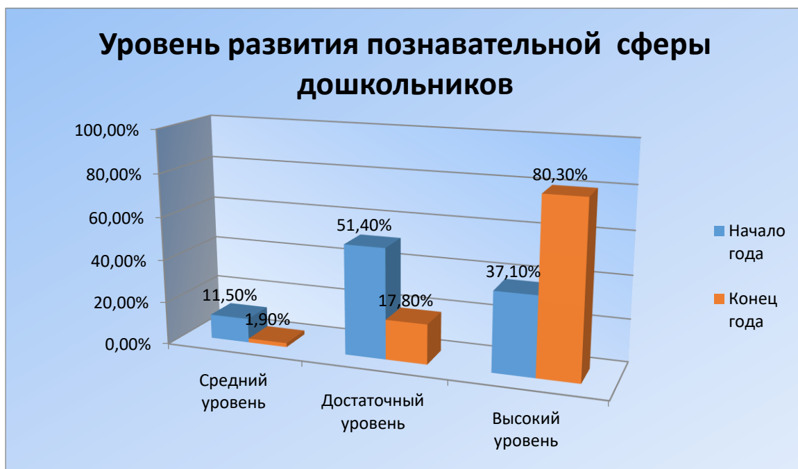
Рис. 1 Уровень развития познавательной сферы дошкольников всех возрастных групп МБДОУ

Результаты диагностики были следующие: все психические процессы развиты в соответствии с возрастной нормой. В результате диагностики по всем возрастным группам выявлено 17,8% детей с достаточным уровнем сформированности познавательной сферы, 80,3% – с высоким уровнем психического развития, со средним уровнем – 1,9% и с низким уровнем – 0%.