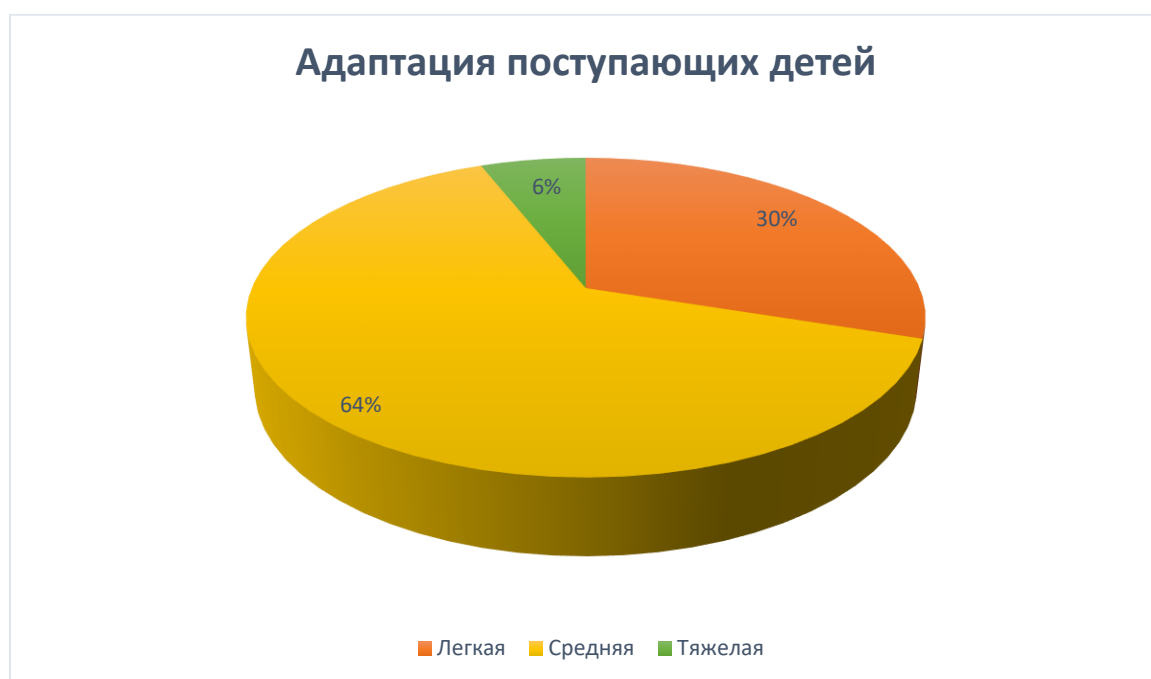
Рис.№4 Показатель успешности адаптации к условиям МБДОУ №86 «Незабудка» вновь поступающих дошкольников в 2022/2023 у.г.

Вывод: процесс адаптации в МБДОУ в 2022/2023 учебном году завершен успешно: процент детей с тяжелой степенью адаптации на конец года составил 6%. Данные результаты достигнуты благодаря совместной работе педагогов, специалистов, администрации детского сада и родителей. Коллективом МБДОУ №86 «Незабудка» создаются условия для первоначального становления личности, формирования основ самосознания и индивидуальности ребёнка: умелое управление процессом привыкания